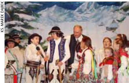
Jasełka nawiązują do najlepszych tradycji salezjańskiego wychowania przez teatr