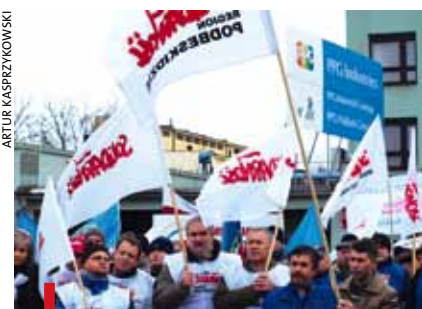
W demonstracji uczestniczyło 300 osób