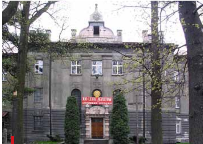
Zajęcia odbywają się w stuletnim gmachu otoczonym malowniczym parkiem