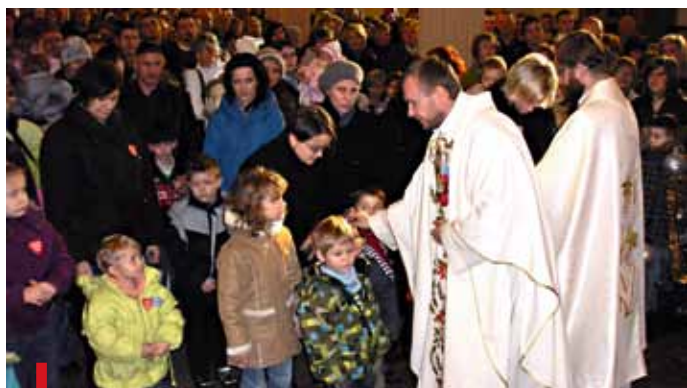
Najmłodszy otrzymują na Górcie specjalne błogosławieństwo