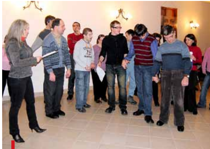
Gromada aktorów ze stowarzyszenia uwielbia występować na scenie. Na zdjęciu: próba przed integracyjnymi jasełkami