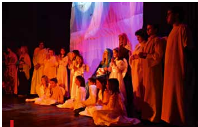
W spektaklu wystąpiło łącznie 40 aktorów