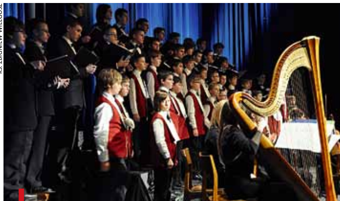
Na scenie w oczu rzucała się przede wszystkim harfa

TARNÓW. 26 grudnia melomani mogli wysłuchać „Oratorium na Boże Narodzenie” Camille’a Saint Saënsa, które uświetniło zakończenie obchodów 680. rocznicy lokacji miasta. Utwór wykonali: chór katedralny Pueri Cantores Tarnovienses, Tarnowska