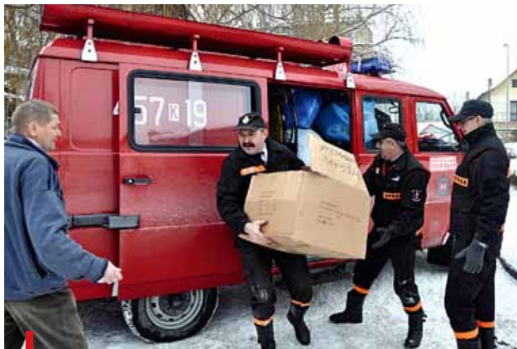
W ostatnim transporcie ochotnicy przywieźli kilkaset kilogramów darów

Od lat strażacy przywożą ciepłą odzież, bieliznę osobistą i pościelową. – Kiedy ścisza mroź, w ośrodku nocuje nawet 70 mężczyzn. Ta pora roku oznacza większe potrzeby. Zaczyna zwykle brakować obuwia