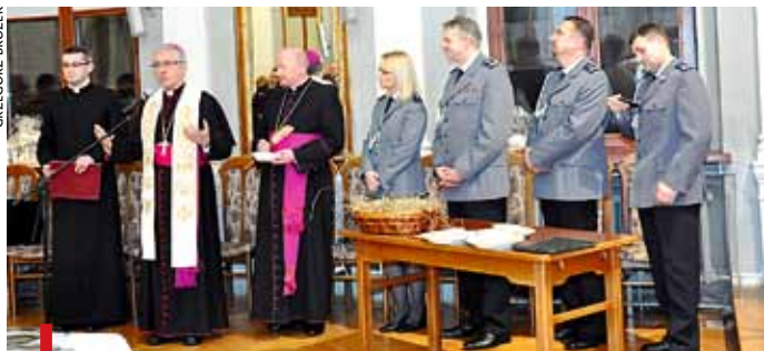
Po Mszy św. duszpasterze i policjanci z całej diecezji zebrali się na okolicznościowym spotkaniu w Sali Lustrzanej