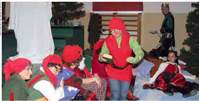
Krasnalami były m.in. nauczycielki chemii i historii

TARNÓW. Ponad 2 tys. zł zebrano podczas przedstawienia „Królewna Śnieżka”, które wystawiono w IV LO. W baśniowe postacie wcieliili się nauczyciele i uczniowie. Macochę grała polonistka, nauczycielki chemii i historii były krasnalami, a dyrektor szkoły