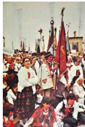
Tarnów, 7 IX 1986 roku. Główna uroczystość zgromadziła tysiące ludzi