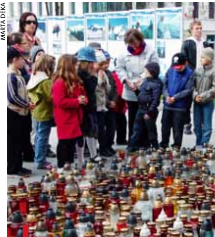
Przed Urzędem Miasta w Radomiu zapłonęły znicze. Przychodzą tu klasy ze swymi nauczycielami