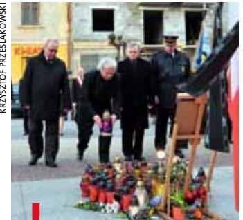
Przed ratuszem ustawiono udekorowane kwiatami i flagami narodowymi zdjęcie pary prezydenckiej. Uczestnicy uroczystości w skupieniu zapalali tu znicze