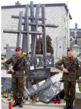
Przed pomnikiem ofiar Katynia zaciągnięto honorową wartę

OPOCZNO. Najpierw 11 kwietnia w kościele pw. Podwyższenia Krzyża Świętego, a dwa dni później w kolegiacie pw. św. Bartłomieja odbyły się celebracje upamiętniające ofiary katastrofy prezydenckiego samolotu oraz poległych 70 lat temu w Katyniu. Wraz z rzeszą wiernych i kombatanami modlili się duszpasterze opoczyńskich parafii oraz przedstawiciele władz miasta i regionu. Obecna była kompania reprezentacyjna Wojska Polskiego oraz liczne poczty sztandarowe. Po Mszy św. z kolegiaty wyruszyła procesja na cmentarz św. Marii Magdaleny, gdzie został poświęcony odnowiony pomnik ofiar Katynia. zn