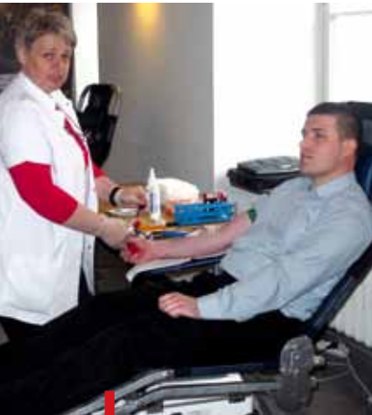
Motocykliści oddawali krew na potrzeby dzieci

RADOM. Miało być jak zawsze, głośno i wesoło. W obliczu katastrofy lotniczej w Smoleńsku motocykliści przybyli do Radomia na imprezę, której już nie można było odwołać, pozostawili tylko jeden punkt z bogatego całodziennego programu. Włączyli się do zbiórki krwi – ten bezcenny dar można było oddać w specjalnym ambulansie, jak i w przygotowanych w Urzędzie Miejskim stanowiskach medycznych. W hołdzie ofiarom katastrofy przejechali też ulicami Radomia. Na swych pojazdach zawiesili biało-czerwone flagi przewiązane czarną szarfą. Na radomskie spotkanie przyjechało około 400 motocykli. kp