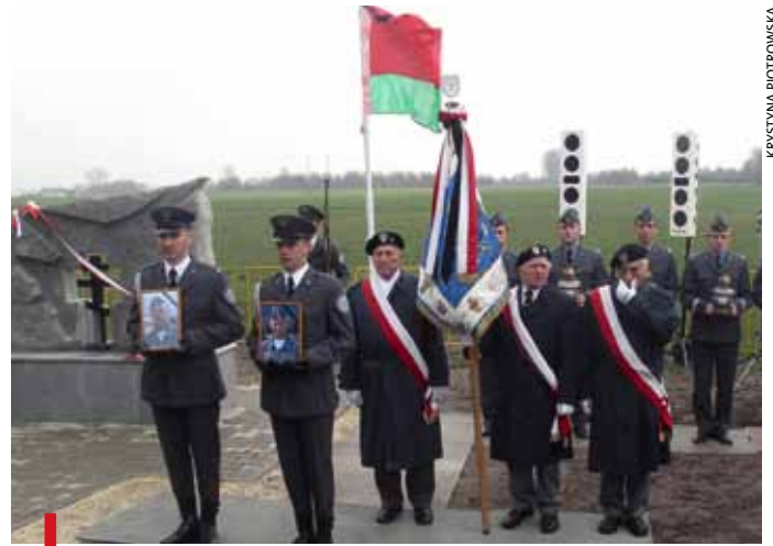
Obelisk stanął w pobliżu miejsca katastrofy białoruskich pilotów

powoli rozchodzili się, wdowy po białoruskich pilotach ze łzami w oczach, jakby na pożegnanie, dotykały zimnego obelisku, a potem wsysały do foliowej torebki garstkę ziemi. Gdzieś wysoko śpiewał skowronek. Krystyna Piotrowska