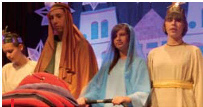
W finale wstąpiło osiem najlepszych klas. Młodzież z Koła Przyjaciół Jana Pawła II przedstawiła jasełka