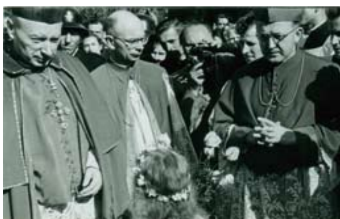
ALBUM RODZINY PLUTÓW