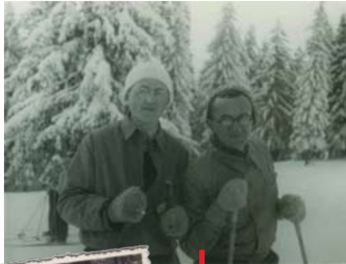
ALBUM RODZINY PLUTÓW