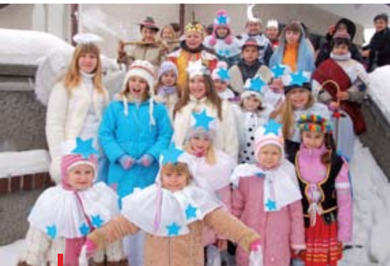
Do grupy teatralnej należy 23 dzieci

ŻAGAŃ. Członkowie grupy teatralnej Szkoły Podstawowej nr 3 im. Jana Pawła II (na zdjęciu) prezentują swe umiejętności na szkolnych uroczystościach. Ale nie tylko. Od trzech lat jasełka przedstawiają szerszej publiczności. 17 stycznia efekt ich miesiecznych prób