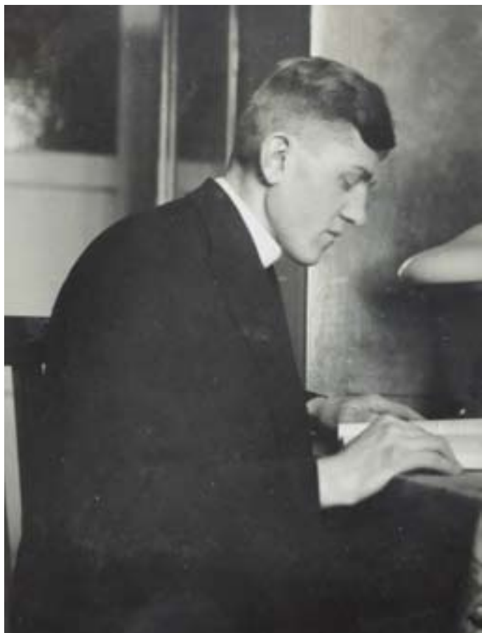
ALBUM RODZINY PLUTÓW

BP WILHELM PLUTA. O słudze Bożym napisano już dużo, ale niewiele jeszcze pokazano. W setną rocznicę jego urodzin publikujemy mało albo wcale nie znane fotografie.