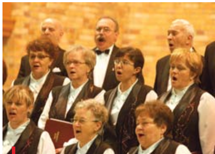
– Największym naszym sukcesem jest to, że przez tyle lat jesteśmy razem – mówią członkowie zespołu