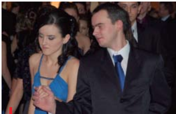
Studniówkę rozpoczął tradycyjny polonez