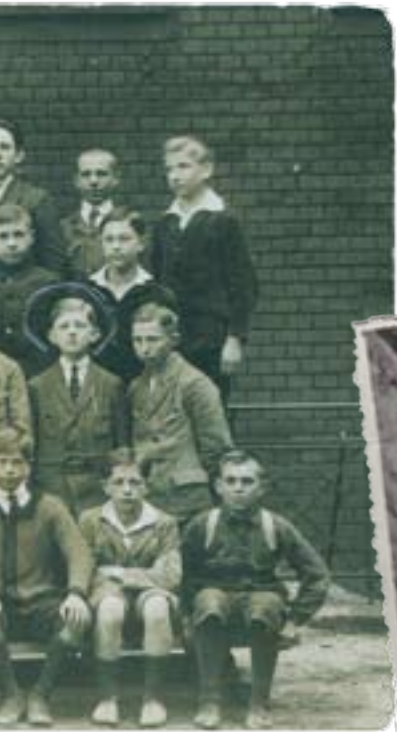
ALBUM RODZINY PLUTÓW