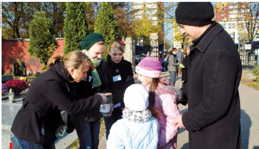
1 LISTOPADA, ZABRZE. Na cmentarzu przy ul. Pokoju wolontariuszki z Gimnazjum nr 13 zbierały datki na rzecz Towarzystwa Pomocy im. św. Brata Alberta

Na zabrzańskich cmentarzach Towarzystwo Pomocy im. św. Brata Alberta zebrało ponad 13,5 tysięcy zł, najwięcej ze wszystkich dotychczasowych kwest. Pieniądze przeznaczone zostaną dla osób najbardziej potrzebujących. Zbiórki organizowane z okazji uroczystości Wszystkich Świętych odbywały się także w innych miejscowościach. W Bytomiu zbierano na ratowanie cmentarnych zabytków, pomoc dla dzieci z najbardziej ubogich rodzin miasta i z za wschodniej granicy czy wspieranie polskiej edukacji na ziemi drohobyckiej. Po raz dziesiąty w tym roku kwestowało też gliwickie Hospicjum Miłosierdzia Bożego. Ze zbiórki i sprzedaży pamiątkowych kalendarzy – cegiełek uzyskano prawie 62 tysięcy zł.