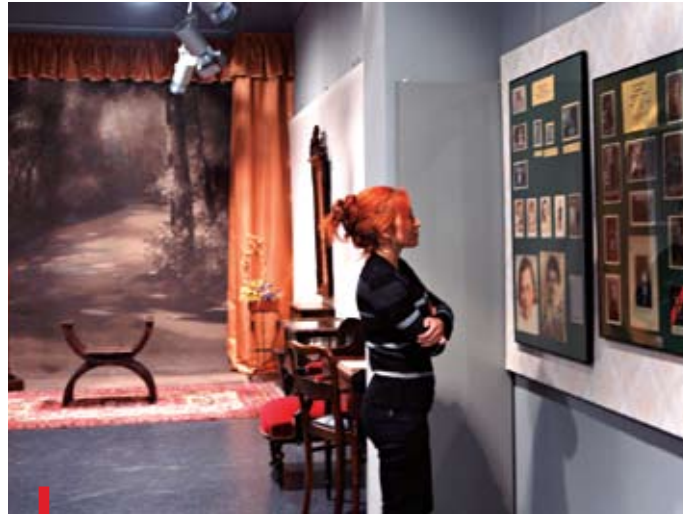
Oprócz zdjęć na wystawie pokazane zostało przedwojenne atelier fotograficzne

Wystawa „Rzemieślnicy i artyści – dawne zabrzańskie atelier fotograficzne 1874–1945” prezentowana jest w Galerii Muzeum Café Silesia. Stare zdjęcia w postaci tekturek zwykle opatrzone są ozdobnymi winietami zakładów, w których powstawały, i notkami biograficznymi znanych zabrzańskich fotografów. – Przy okazji tworzenia wystawy poznawaliśmy też specyfikę poszczególnych