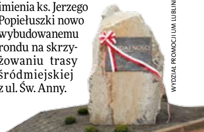
WYDZIAŁ PROMOCJI UM LUBLINIEC

LUBLINIEC. Aleja Solidarności – taką nazwę będzie nosić trasa śródmiejska, otwarta i poświęcona 28 października. Podczas uroczystości otwarcia odsłonięty został pamiątkowy kamień (na zdjęciu). Dzień wcześniej Rada Miejska podjęła uchwałę o nadaniu imienia ks. Jerzego Popiełuszki nowo wybudowanemu rondowi na skrzyżowaniu trasy śródmiejskiej z ul. Św. Anny.