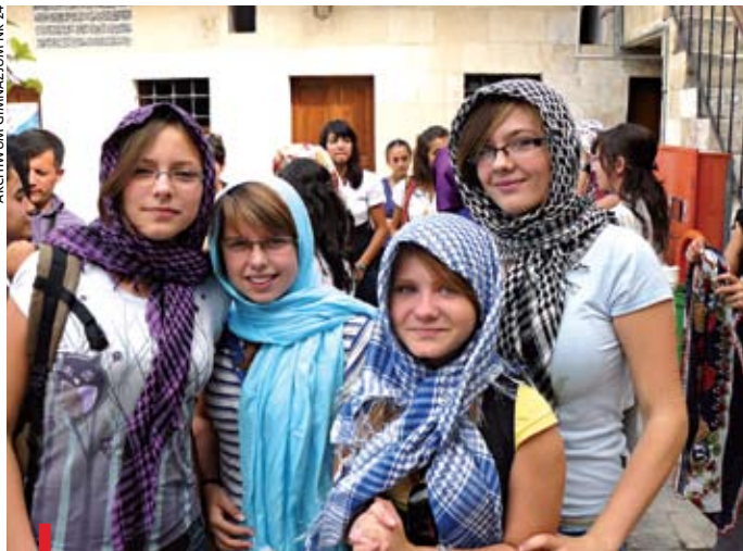
Uczennice z Zabrze przed wejściem do meczetu w Antiochii

Cztery uczennice pod opieką dwóch nauczycieli z Gimnazjum nr 24 w Zabrzu przebywały w drugiej połowie października w szkole partnerskiej w Osmaniye w Turcji .