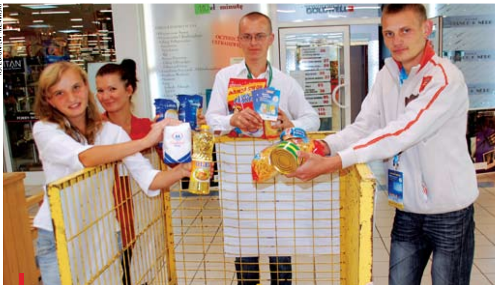
RADOM. Konserwy, makarony, olej, mąka i cukier – te produkty najczęściej wrzucano do naszych koszyków – mówią radomscy wolontariusze

W akcji Banku Żywności „Podziel się posiłkiem” bierzemy udział pierwszy raz. Jest bardzo fajnie. Cieszy nas to, że ludzie wychodzący z marketu wrzucali do naszych koszy dużo produktów – mówią wolontariusze ze specjalnego Ośrodka Szkolno-Wychowawczego przy ul. Grzecznarowskiego w Radomiu. Kwestowali w supermarkecie E. Leclerc. Stali się częścią 30-tysięcznej armii osób zbierających produkty żywnościowe w sklepach całej Polski. Marzeniem organizatorów kolejnej akcji Banku Żywności było zebranie produktów, które wystarczą na sporządzenie miliona posiłków dla niedożywionych dzieci. Ta zbiórka to ważna zachęta do obchodów 65. Tygodnia Miłosierdzia, który rozpoczyna się 4 października. Przyswiecać mu będzie hasło: „Otoczmy troską życie”.