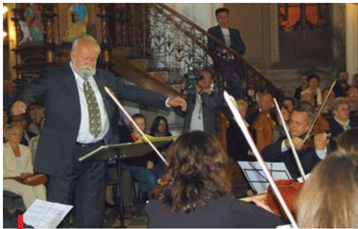
Krzysztof Penderecki, największy współczesny polski kompozytor i dyrygent, wystąpił w naszej katedrze po raz trzeci