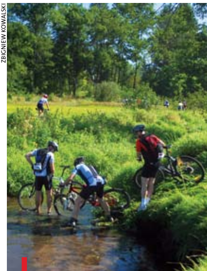
Na trasie maratonu na zawodników czekało wiele wyzwań