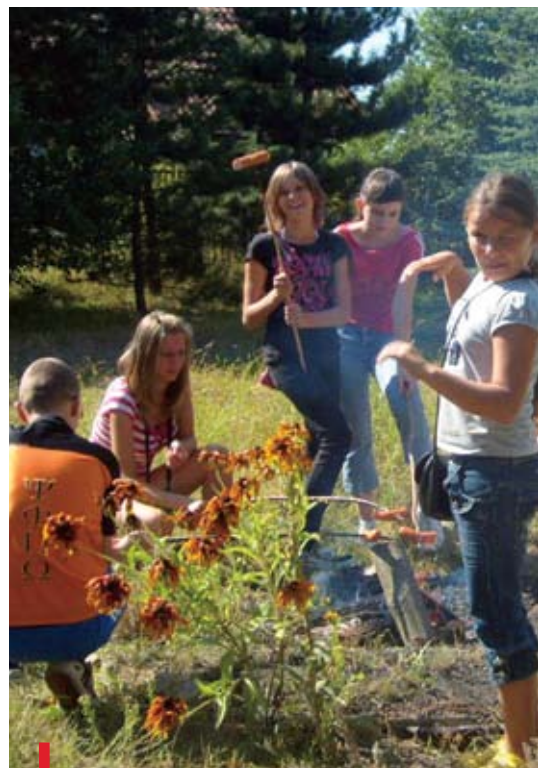
Wakacyjne ognisko na działce we Wsoli