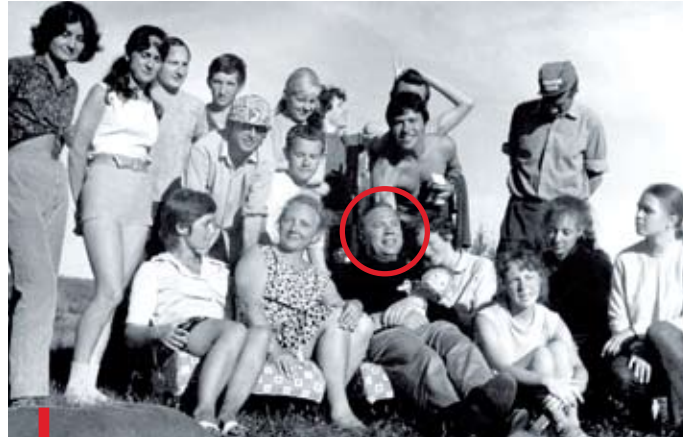
Jeden z letnich obozów studenckich – Ostrowo 1971 rok