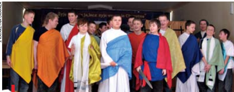
W ramach rekolekcji przedstawienie „Obrazki z życia św. Pawła” przygotowali gimnazjaliści z kl. I b