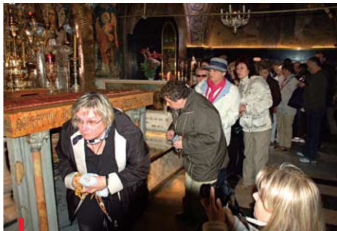
Stacja XII Drogi Krzyżowej na Kalwarii. Tu pod ołtarz wchodzi się po kolei, by dotknąć skały, na której stał krzyż