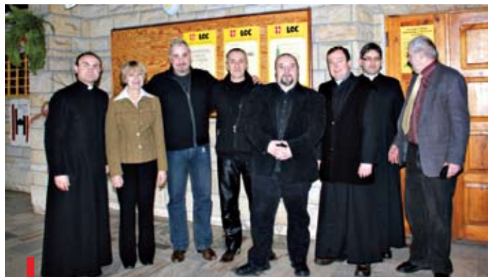
Muzycy i organizatorzy koncertu w Lipskim Centrum Kultury