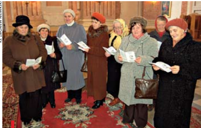
W Kazanowie koło Końskich grupa kobiet złożyła przyrzeczenie i włączyła się w dzieło duchowej adopcji dziecka poczętego

znajduje się obok budynku kurii diecezjalnej. Ten dzień był także okazją do podjęcia dzieła duchowej adopcji dziecka poczętego. Uczestnicy zobowiązują się przez dziewięć miesięcy do codziennej modlitwy i podejmowania drobnych wyrzeczeń w intencji dziecka zagrożonego aborcją. zn