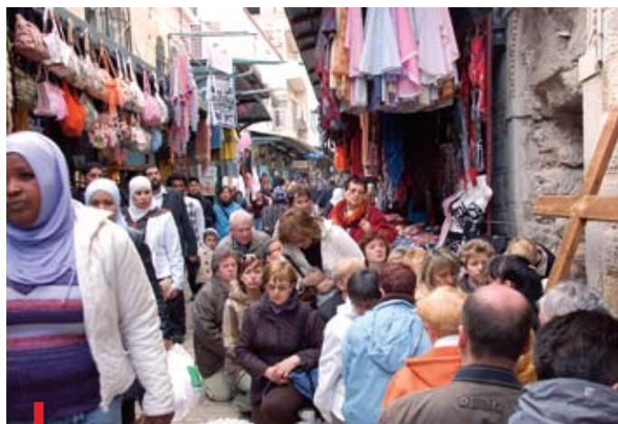
Życie Jerozolimy toczy się swoimi rytмами. Gdy pątnicy modlą się, inni śpieszą do swoich zajęć