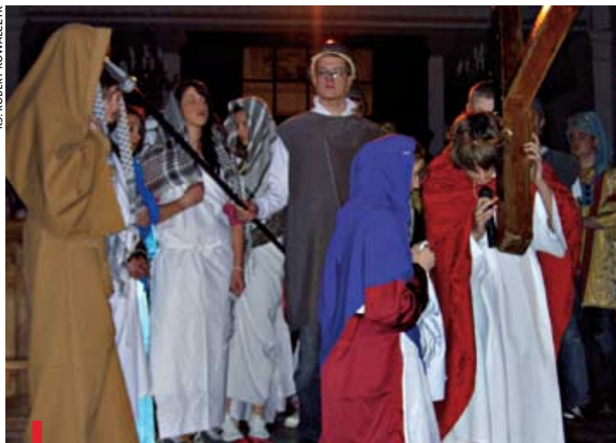
Spektakl przygotowała młodzież z kolegiaty pw. św. Bartłomieja

czas nawrócenia, pokuty i przygotowania się do świąt Wielkiej Nocy, ale też dobry moment uświadomienia sobie, że gdyby nie było zmartwychwstania, daremna byłaby nasza wiara. Młodzież włożyła dużo pracy i trudu w przygotowanie misterium. Zgromadzeni w kościele widzowie nie ukrywali wzruszenia, a całość nagrodzona została gorącymi brawami. kj