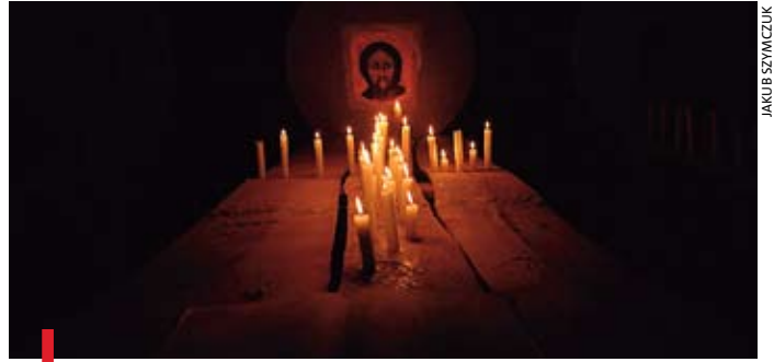
Pokuta i nawrócenie – to nasze zadania na Wielki Post

Warto już teraz zarezerwować sobie czas na „duchowe sprzątanie”.