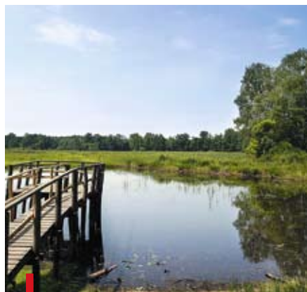
Świątynnym miejscem na fotografowanie przyrody są lasy koło Kochanowic. Na zdjęciu położony w środku staw Stara Brzoza

Zdjęcia będą oceniane w trzech kategoriach: uczniowie szkoły podstawowej, gimnazjum i dorośli. Prace należy przesłać jako fotografie wielkości przynajmniej 20 x 30 cm oraz pliki cyfrowe (zapisane na nośniku CD/DVD w rozdzielczości minimum 1770 x 2400 pikseli). Każda z informacją zawierającą datę i miejsce wykonania oraz krótki opis tego, co znajduje się na fotografii. Na pracę konkursową powinny się składać cztery zdjęcia, wykonane w czterech porach roku. Należy je przesłać dopiero pod koniec roku, do 24 listopada pod adresem: Gminne Centrum