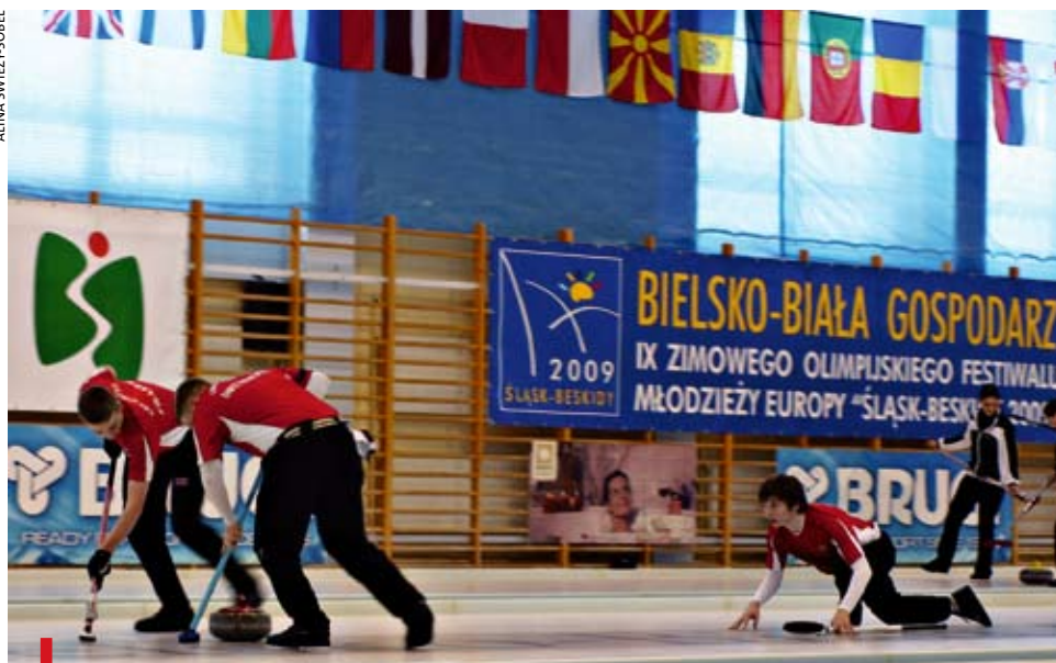
FINAŁOWY MECZ W CURLINGU CHŁOPCÓW SZWAJCARIA – WIELKA BRYTANIA

Ogień olimpijski płonął w Szczyrku, Wiśle, Tychach, Cieszynie i Bielsku-Białej, gdzie do 20 lutego odbywały się zawody IX Zimowego Olimpijskiego Festiwalu Młodzieży Europy. O medale walczyli łyżwiarze, narciarze, biathloniści, snowboardziści, hokeiści oraz curlerzy. Sunące po lodzie kamienie i szcztokujących lodź zawodników czyli rozgrywki w mało znanym u nas curlingu można było oglądać w Bielsku-Białej, gdzie zmierzyli się zawodnicy i zawodniczki z siedmiu krajów. Wystartowali też Polacy, choć ta dyscyplina obecna jest u nas zaledwie od 5 lat. W finale spotkały się drużyny Szwajcarii i Wielkiej Brytanii. Wygrali Szwajcarzy, a finałowy mecz dziewcząt – drużyna brytyjska.