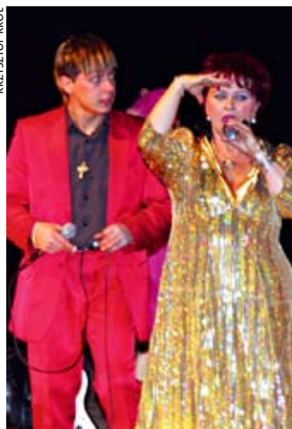
Na scenie TCK wystąpił między innymi zespół Golden Mix