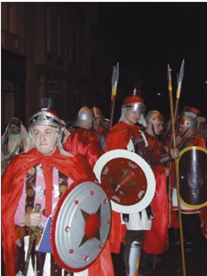
Droga Krzyżowa ulicami Środy Śląskiej

św., a także ucałować relikwie Krzyża Świętego. W Wielki Piątek również mieszkańcy Ziębic uczestniczą w Drodze Krzyżowej ulicami miasta. – Krzyż niosą przedstawiciele wszystkich stanów: ojcowie, matki, dzieci, przedsiębiorcy, samorządowcy, mundurowi, a na końcu również księża – wyjaśnia ks. B. Konopka. ■