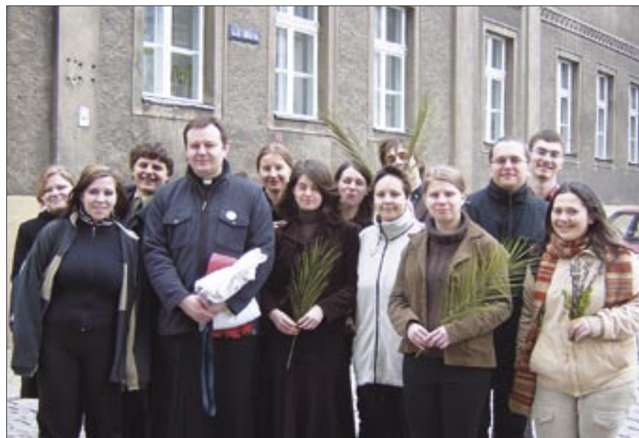
ARCHIWUM DIECEZJALNEGO DUSZPASTERSTWA MŁODZIEŻY