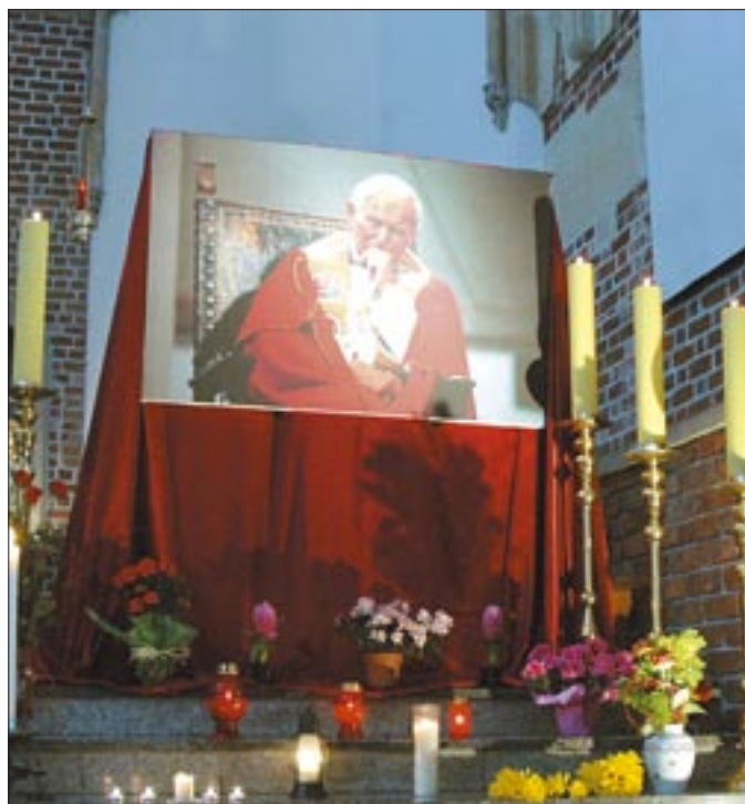
W ubiegłym roku rozważaniom Drogi Krzyżowej towarzyszył portret Jana Pawła II