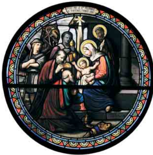
Betelem, witraże z kościoła św. Katarzyny i z Karmelu Dzieciątka Jezus