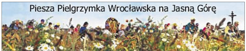
Piesza Pielgrzymka Wrocławska na Jasną Górę

Z katedry wrocławskiej, o godz. 6.00, w środę 2 sierpnia, pielgrzymi wyruszą do Częstochowy, do której przybędą w czwartek 10 sierpnia.