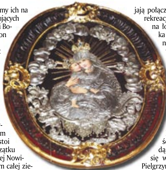
Obraz Patronki nowego sanktuarium w ołtarzu głównym