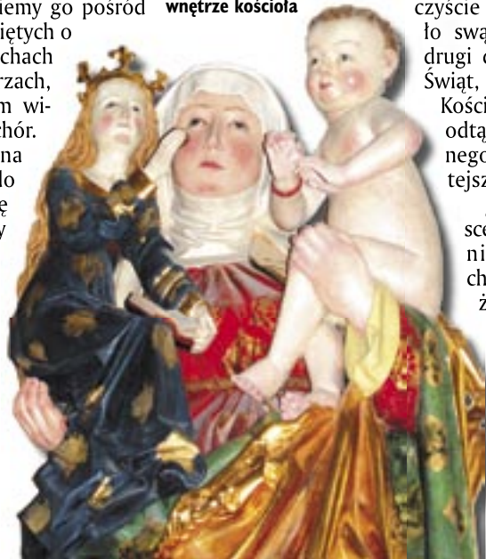
Św. Anna Samotrzecia – jedna z czterech gotyckich figur zdobiących wnętrze kościoła