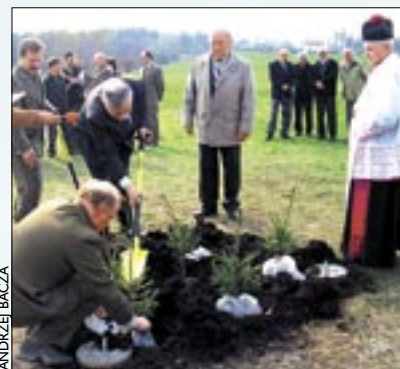
Papieskie drzewko posadzone w towarzystwie świerków istebniańskich