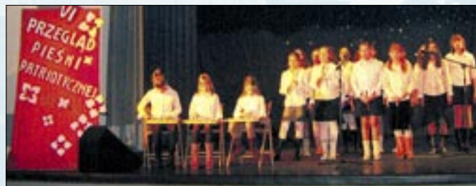
Występy nagrodzonych śpiewaków stanowią ważne dopełnienie patriotycznego świętowania

Bielsku-Białej Hałcnowie zostanie odprawiona Msza święta z udziałem członków Akcji, a po niej w hałcnowskim Domu Kultury odbędzie się akademie, w czasie której nagrody odbiorą finaliści VI Przeglądu Pieśni Patriotycznej im. Małgorzaty Papiurek.