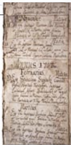
Chociaż ta księga metrykalna pochodzi z XVII wieku, atrament jest wciąż doskonale czytelny

Kilka lat temu Stowarzyszenie Rodzin Ruchu Światło-Życie – Oaza Rodzin – odkupiło od parafii hektar ziemi. Zgodnie z planami obok kościoła ma powstać dom, dla formacji Oazy Rodzin i całego ruchu, ale nie tylko. To doskonałe miejsce, świetnie usytuowane, z dobrym dojazdem do miasta. Będą mogli z niego korzystać wspólnoty działające w Kościele, ale ma on być również otwarty dla organizatorów szkoleń czy spotkań firmowych. Na miejscu będzie kaplica, zaplecze gastronomiczne, 25 pokoi 4-osobowych, z sanitariatami w każdym, pojedyncze pokoje dla prowadzących, kilka sal konferencyjnych, parking i ogród z tyłu domu. Na terenie parafii znajduje się szkoła podstawowa oraz dom pomocy społecznej dla ponad 150 podopiecznych