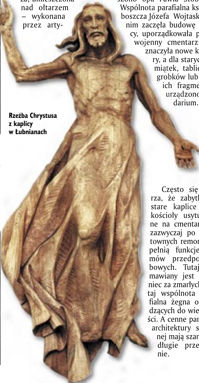
Rzeźba Chrystusa z kaplicy w Łubnianach