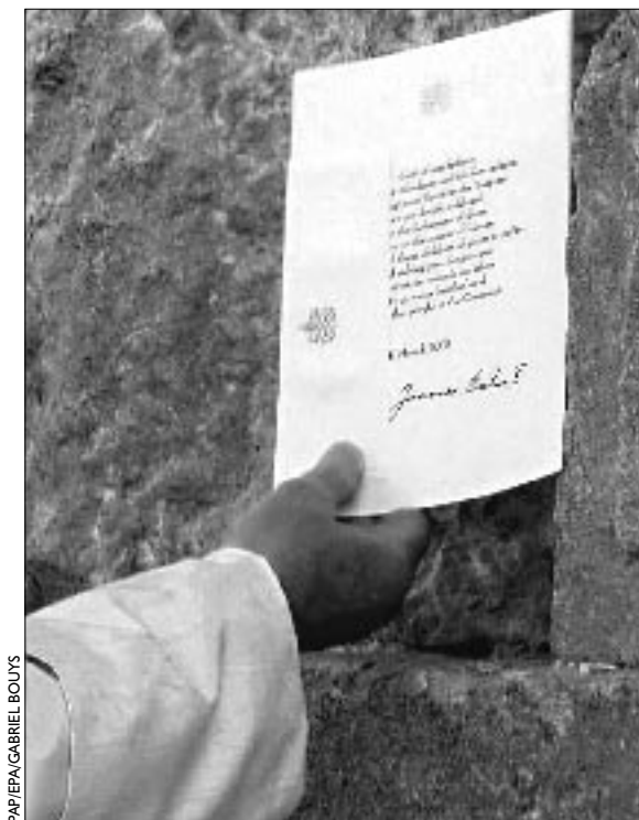
PAPIEŻA

Jan Paweł II uczynił bardzo wiele dla zbudowania braterskich relacji żydowsko-chrześcijańskich. Był pierwszym papieżem, który przekroczył próg synagogi (Rzym 13 IV 1986). Podczas pielgrzymki do Ziemi Świętej w roku 2000 symboliczne znaczenie miały dwa wydarzenia: odwiedziny Instytutu Pamięci Yad Vashem i modlitwa przy zachodniej ścianie świątyni, zwanej Ścianą Płaczu. Modlitwa Papieża przy Ścianie Płaczu przypominała, że chrześcijanie i żydzi modlą się do tego samego Boga. Wymownym gestem było pozostawienie przez Ojca Świętego w szczelnie muru kartki z tekstem modlitwy. Była to ta sama prośba o przebaczenie dla wszystkich, którzy stali się przyczyną cierpienia narodu wybranego, jaka została wypowiedziana w Dniu Przebaczenia w Bazylice św. Piotra.