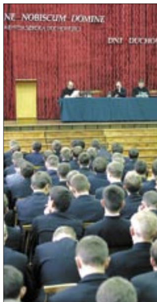
Głównym tematem obrad była Eucharystia

– Żyjemy w świecie pełnym paradoksów. Z jednej strony świat odsuwa duchowość, spycha ją na dalszy plan, koncentrując się na materialnym aspekcie życia, a z drugiej wciąż pojawiają się nowe propozycje duchowości, przyciągające wielu zwolenników, fascynując, porwują. Można więc powiedzieć, że ludzie tęsknią za duchowo-