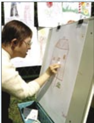
Już trudno wyobrazić sobie maj bez Ulicy Integracyjnej na Kole.