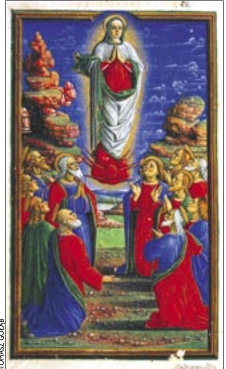
Wniebowzięcie Najświętszej Maryi Panny – miniatura w Złotej legendzie Jakuba de Voraigne

Ordynację Zamojską założył twórca potęgi rodu Zamojskich herbu Jelita, hetman wielki i kanclerz wielki koronny Jan Sariusz Zamojski. Wybitny mąż stanu był również zapobiegliwym gospodarzem, co pozwoliło zgromadzić mu ogromny majątek. W skład ordynacji weszła część dóbr własnych Zamojskiego, której centralnym ośrodkiem był Zamość. Należało do niej 5 miast i 149 wsi. Ordynacja posiadała własne wojsko, wyższą uczelnię, Akademię Zamojską, drukarnię oraz sąd (trybunał). Zamojski założył także Bibliotekę Ordynacji, która służyła profesorom akademii zamojskiej i kształceniu edytorów miejscowej drukarni. W 1811 roku biblioteka została przeniesiona do Warszawy. W 1885 roku posiadała duże zbiory numizmatyczne, unikatowe zbiory archiwalne, cenne pamiątki narodowe i księgozbiór złożony z 52 705 tytułów. Do najcenniejszych dzieł należały: Mszał (sakramentarz) Tyniecki z XI wieku, część Kodeksu Supraśkiego z XI wieku, będącego jednym z dwóch, obok Księgi Sawy, pomników języka starocerkiewnego, XIV-wieczny rękopis kroniki Galla Anonima i wiele innych ważnych zabytków piśmiennictwa.