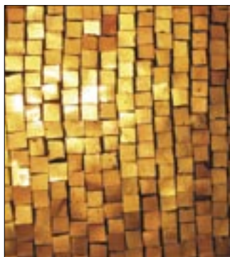
U góry: Wpis w złotej księdze katedry Chrystusa Króla