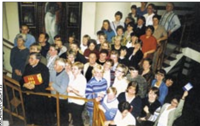
Grupa 33 podczas dni skupienia w Brennej

To tylko jedno z wielu świadectw, jakie znaleźć można na stronie internetowej www.grupa33.katowice.opoka.org.pl . Grupa 33, której nazwa pochodzi od liczby lat ziemskiego życia Chrystusa, gromadzi osoby w wieku od 25 do 55 lat, żyjące w stanie wolnym. „Pragniemy rozeznaczyć swoje powołanie i zrealizować je zgodnie z wolą Bożą. Wiemy, że nasze życie ma sens i można być szczęśliwym, nawet nie będąc żoną czy mężem, mat-