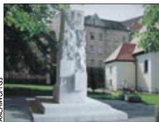
Wizualizacja projektu pomnika

Na placu Kościelnym w Wałbrzychu ma powstać pomnik Niepodległości.