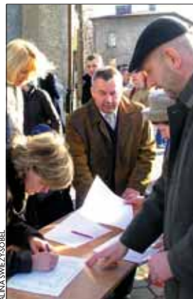
Wierni w Dankowicach składali swe podpisy 9 stycznia, zaraz po Mszy świętej

Ustawy te m.in. pozbawiają dzieci poczęte prawnej ochrony życia, zezwalają na przerwanie ciąży u osoby nieletniej bez wiedzy rodziców, na bezpłatny dostęp do środków antykoncepcyjnych, przymusową edukację seksualną od pierwszej klasy szkoły podstawowej, a także legalizują związki homoseksualne. „Zbieranie podpisów będziemy w najbliższych tygodniach kontynuować. Chcemy uświadomić posłom, jakie jest stanowisko katolików w Polsce na ten temat, a także dotrzeć do społeczeń-