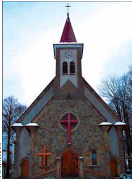
Rozbudowa kościoła w Targanicach trwała nieustannie do 1991 roku

Targanice od 1999 r. znajdują się w powiecie wadowickim. Ale to nie jest jedyny powód do poszukiwania związków z Papieżem. W samym centrum miejscowości, tuż obok kościoła, znajduje się Zespół Szkół Samorządowych, który nosi imię Jana Pawła II. Ciekawostką jest fakt, iż jest to jedna z pierwszych w Polsce szkół papieskich. Pierwsze starania